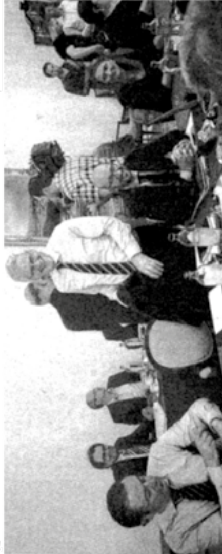
Négociations pour la formation du gouvernement fédéral, le 25 juillet dernier. De g. à dr. Bart De Wever (N-VA), Kris Peeters (CD&V), Charles Michel (MR) et Gwendolyn Rutten (Open VLD).

Le collectif Roosevelt.be est un mouvement citoyen pluraliste, soutenu par un ensemble de personnalités de différents horizons. Il lance, ci-dessous, une série de suggestions aux différents gouvernements, déjà formés ou encore en négociations, issus des élections du 25 mai dernier.