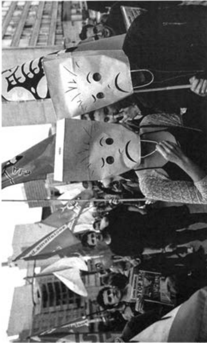
Les SAC sont loin de faire l'unanimité. En témoigne cette manifestation d'octobre 2013.

Bruxelles SAC Bruxelles présente son mémorandum aux pouvoirs locaux.