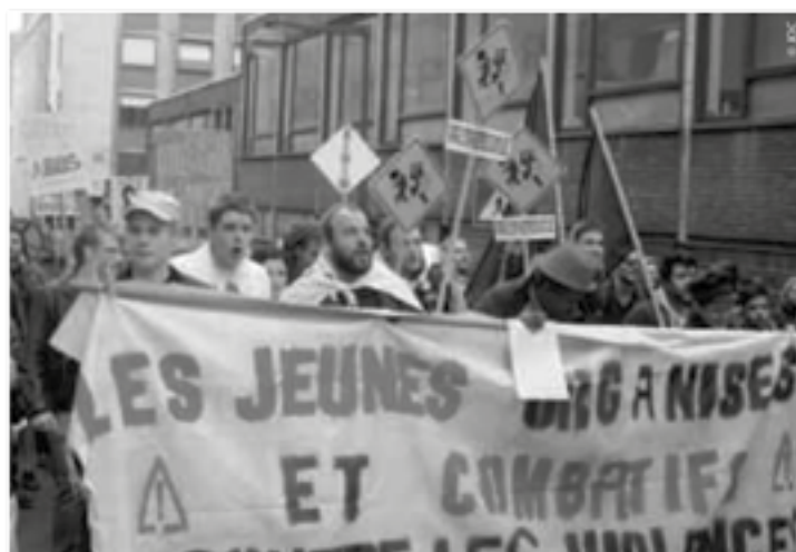
JEUNES JOCISTES. Ce sont eux qui sont à la source du changement de nom.

La JOC a changé la signification des initiales de son nom, en y supprimant les références « ouvrière » et « chrétienne ». À deux doigts de la béatification, Mgr Cardijn allait-il, une fois encore, se retourner dans sa tombe ? Une jeune permanente régionale, une ancienne présidente fédérale, et le responsable du CJC s'expliquent : « Le choix vient des jeunes jocistes. Il est mûrement réfléchi. »