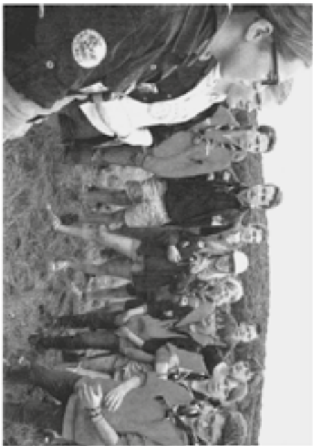
En général, un médiateur suffit pour les petits scouts liés à un camp scout. Mais lorsqu'il faut une action répressive, c'est une autre affaire...

monaire. Au fin de ma relation, j'ai rédigé son rapport où je mentionnais certains points à améliorer. Je pense notamment qu'il faudrait plus de rencontres entre les jeunes et la population locale. Je pense aussi qu'un médiateur n'est pas suffisant. »