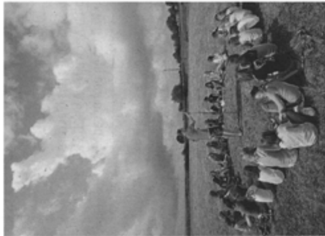
Scouts comme patronnés - Ici, un camp du Patro Notre-Dame de Dhuy - animeront les campagnes pendant la période des vacances estivales.