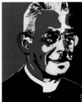
JOSEPH CARDIJN. Une méthode qui pousse des jeunes à résister.

Certains commentateurs présentent Cardijn comme un homme d'action enthousiaste, scandalisé par la misère des jeunes ouvriers du début